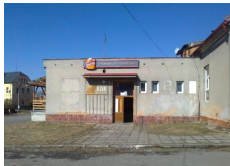
chybějící dveře u Pohostinství