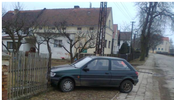
havárie u Zounů