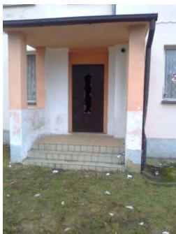
zničená výplň dveří MŠ