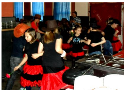
Vystoupení žáků školy v Čerňovicích 29.3. 2012 na setkání MAS Český západ - Místní partnerství

- někteří občané nedovoleně skládkují komunální odpad v zahradě zámku, kde vzniká nepovolená skládka; v případě zjištění porušení zákazu skládkování či vstupu na soukromý pozemek bude celá věc předána k šetření Policii ČR